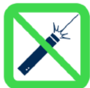
Pointeurs laser Laser Pointers