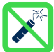
Articles pyrotechniques et matériels explosifs Pyrotechnics and explosive materials