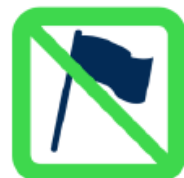
Hampes rigides, fagots de drapeaux Flagpoles