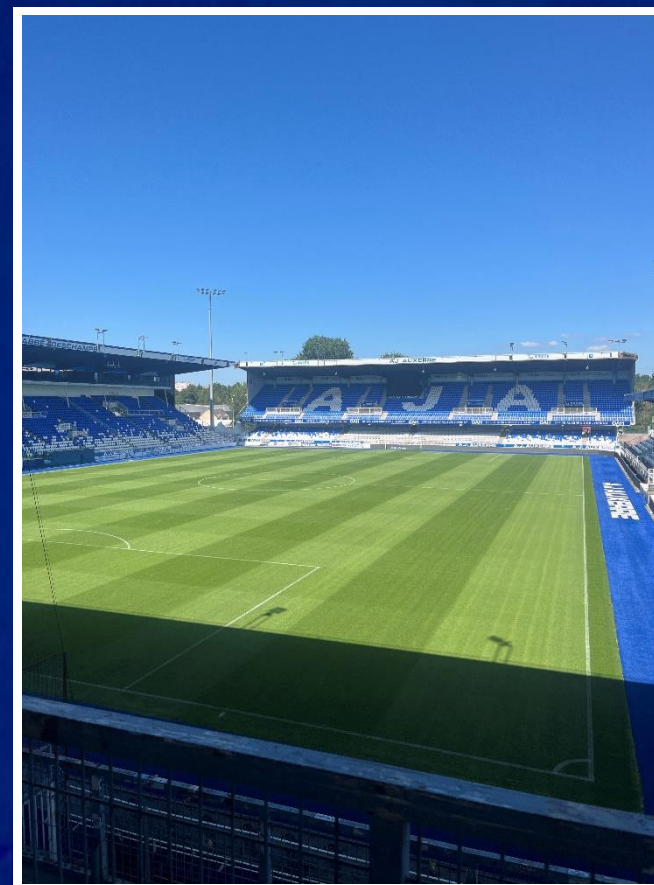
Vue depuis la tribune