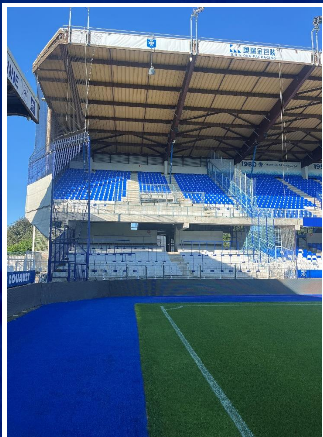
Vue depuis le terrain

L'accès au stationnement est interdit jusqu'à la fin de la période de rétention (environ 30 min, en moyenne)