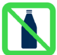
Bouteilles - Contenants à bouchon - Verres - Canettes Bottles - Cork containers - Glasses - Cans