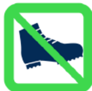
Chaussures de sécurité Safety Footwears